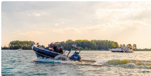
Onze handhavingsboot op het Brielse Meer.

Het waterschap beheert veel vaarwegen in onze regio. Zoals het Brielse Meer, de Binnenmaas, het Waaltje en de Bernisse. We controleren er of mensen zich aan de regels houden.