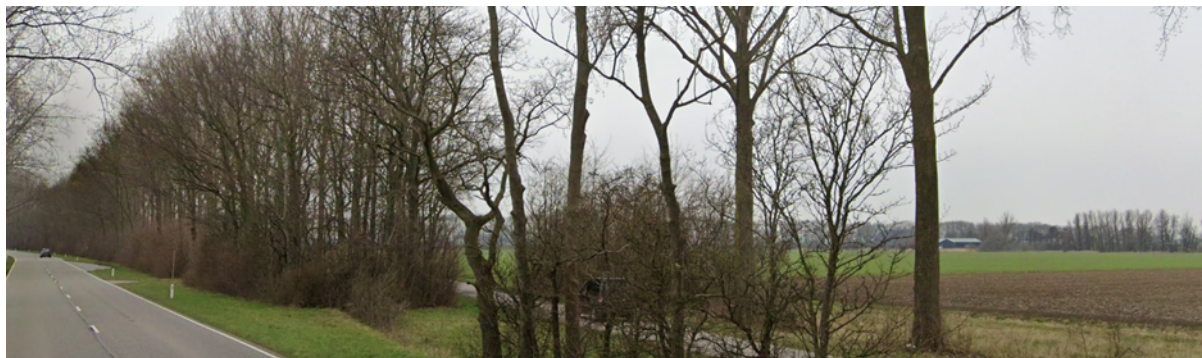
Figuur 2. Voorbeeld Houtwal, Provinciale weg te Numansdorp

Er vindt geen dunning plaats. Dode bomen worden veiliggesteld en blijven als liggend of staand dood hout achter in het vak.