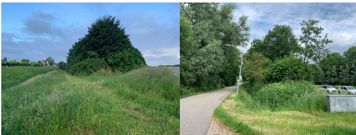
Figuur 1. Voorbeelden bosplantsoen

Onderhoudsfrequentie: eens per 6-12 jaar.