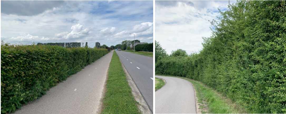
Figuur 3. Voorbeelden intensief gesnoeide haag