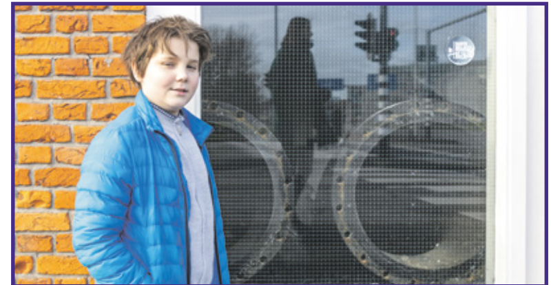
Kende bekijkt oude rioolbuizen die in het rioolgemaal liggen.