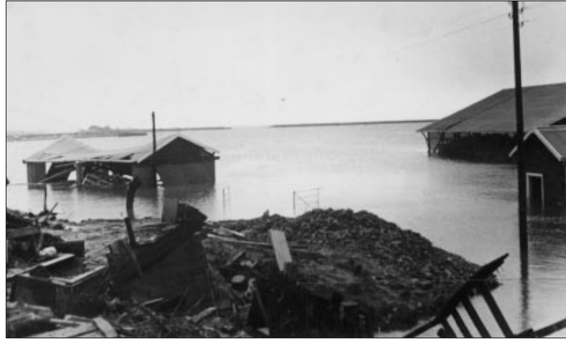
Het bedrijf van Houthandel Van Prooijen aan de Numansdorps Havenkade viel ten prooi aan het water

dijk lagen, was 44% van het oppervlak ondergelopen en nog eens 32% heeft dras gestaan. Ook alle buiten de ringdijk gelegen polders, die veelal van een eigen hoogwaterkering waren voorzien, waren compleet ondergelopen. Op één na: de Westerse Polder.