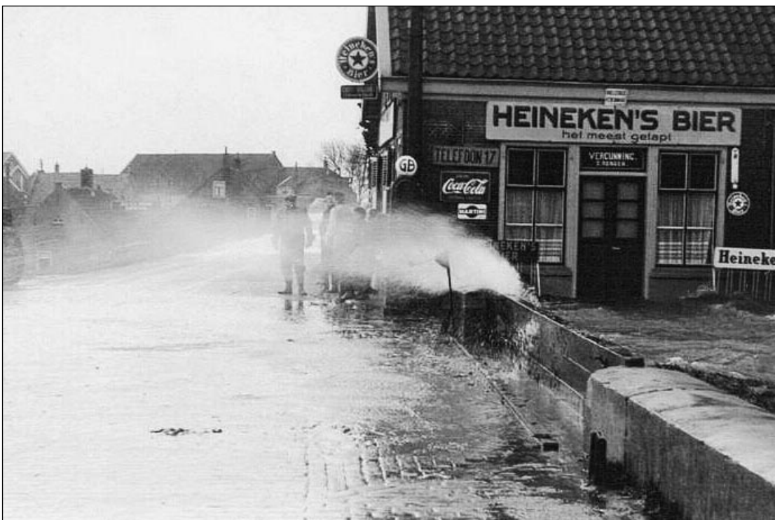
Café Rongen kreeg het ook zwaar te verduren

slaapkamer beneden waar toen al ongeveer 10 centimeter water stond. Het was het werk van enkele minuten om de kleren zo hoog te leggen dat het water er niet bij kon. Toen ik terugwaarde naar de schuur, liepen mijn hoge laarzen vol. Dus het water steeg in die enkele minuten zo'n 60 à 70 centimeter. In korte tijd stond het water zo hoog, dat een weckfles die in de vensterbank stond, vol met water was. Toen we in de kamer naar het wassende water keken, zagen we de eierkoeien die mijn moeder zaterdagavond bij het tafeldekken al had klaar gelegd voor de zondagmorgen, in de kamer rondrijven.