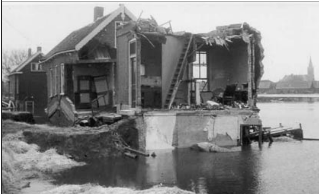
De ravage was enorm 'zoals hier aan de Molendijk in 's-Gravendeel'.