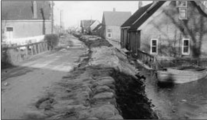
De Oud-Bonaventuresdijk in Strijen

'Het was een donkere nacht, maar die witte schuimkoppen verlichtten de omgeving'