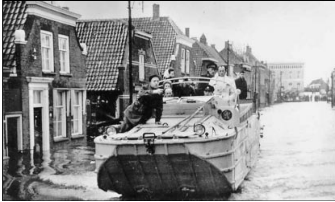
Een amfibievoertuig vaart door de Burgemeester de Zeeuwstraat in Numansdorp.