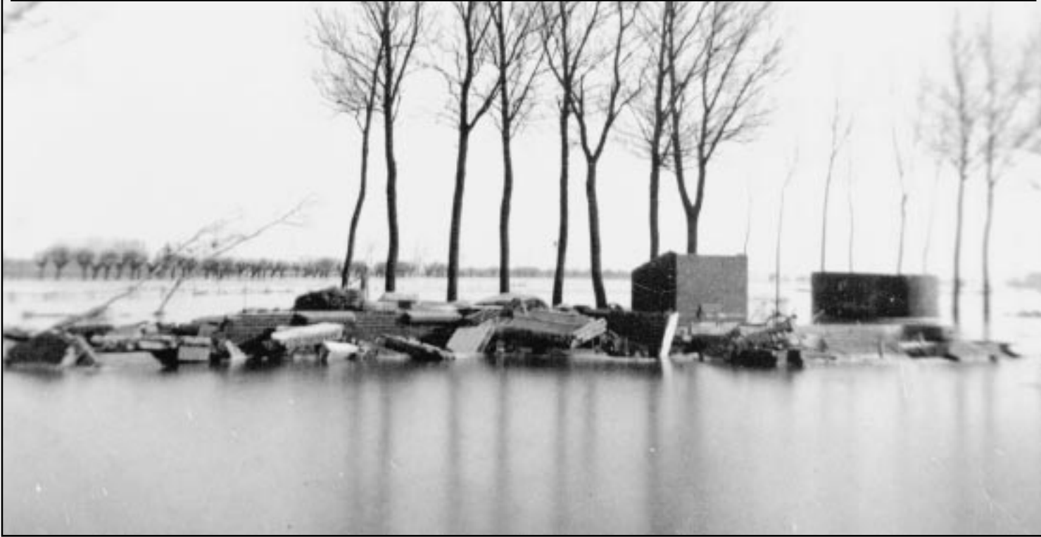
De Buitendijk behoorde tot één van de zwaarst getroffen gebieden

STRIJEN - 1 februari 1953. Als een dief in de nacht kondigt zich De Ramp aan. Een nacht vol ramspoed verandert ook het leven van dat toen 14-jarige meisje uit de Strijense polder. Met eigen ogen zag ze het complete Hollandsch Diep, zoals zij het destijds ervoer, op de boerderij van haar familie aan komen rollen. Angstig en naïef kruipt ze ondanks die onbekende dreiging haar bed in op de zolder. Het water had reeds bezit genomen van de benedenverdieping en het zolderluik klapperde reeds vervaarlijk.