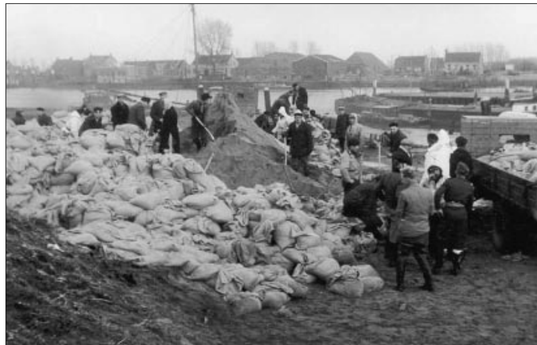
Met man en macht werd gewerkt aan de herstelwerkzaamheden, zoals hier aan het Nieuwe Veer in 's-Gravendeel