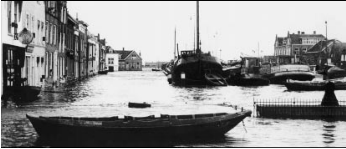
De toen nog buitendijks gelegen Havendam liep wel volledig onder water

OUDE-BEIJERLAND - Een uitstekende aanvoerhaven, in tact gebleven voorzieningen zoals water en elektriciteit, grote gebouwen die men benutte voor opvang, opslag en organisatie, Oud-Beijerland werd nauwelijks getroffen door het water, en kon daardoor het eiland grote steun bieden. In de pers werd vooral vol lof gesproken over de rol van Oud-Beijerland bij de coördinatie van alle activiteiten door het waterschap samen met de burgemeesters, de zogenoemde Generale Staf. Die samenwerking verliep voorbeeldig. Het dagblad "Trouw" noemde Oud-Beijerland in die tijd een zegen voor de Hoeksche Waard. De Stichting "Het Oude Raadhuis" herdenkt met een tentoonstelling de Watersnood, vanuit het perspectief van Oud-Beijerland.