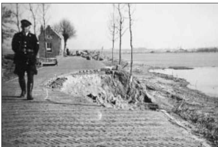
Veldwachter Luuk Brouwer inspecteert de Molendijk in 's-Gravendeel