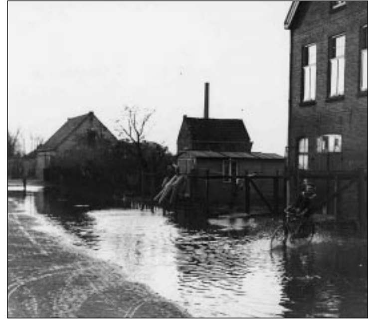
Het water stijgt, de foto is genomen op het Gedempte Spui, in de volksmond Achterspui, ter hoogte van de plek waar nu de ingang van het Vierwiekenplein is

met de berichtgeving over een ramp aan de orde komt, ontbrekt in 1953. In onze tijd zijn we gewend aan schokkende foto's, onder de foto's van toen zitten geen horrorbeelden. Wel geven ze een feitelijk en overtuigend beeld van de aangerichte ravage en vluchtende mensen. De angst en de verschrikking in de ogen, de reddingsacties en het verdriet van kinderen. Ook de radioreportages op de CD, zijn veel terughoudender van toon dan tegenwoordig. De feiten en de emoties spreken voor zich - een nu gebruikelijke vraag als "Wat ging er door u heen?" past daar niet bij. De woordkeus lijkt heel wat formeler dan die van nu en de reporter verraadt zijn eigen emotie voornamelijk in de trilling van zijn stem. De Stichting "Het Oude Raadhuis" herdenkt met deze tentoonstelling de Watersnood, vanuit het perspectief van Oud-Beijerland. Tegelijkertijd brengt het bezoekers terug in een heel andere tijd. De expositie "Oud-Beijerland en de Watersnood" is voor bezoekers geopend van zaterdag 1 februari tot 30 april, elke zaterdag en woensdag van 13 uur tot 16 uur.