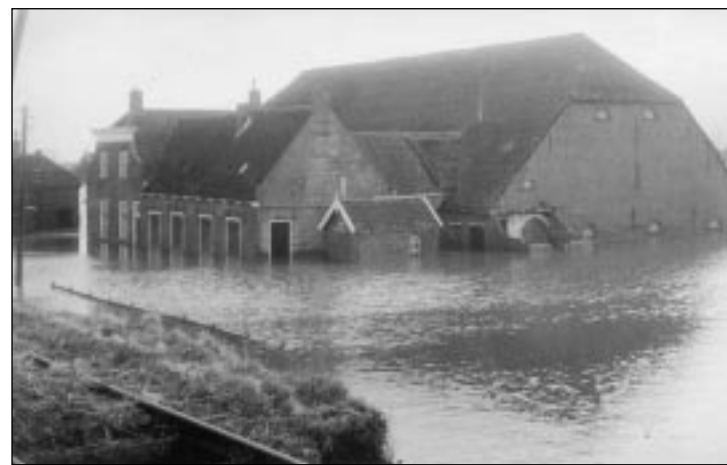
In Piershil steeg het water tot ongekende hoogte, zoals hier bij een boerderij aan het Hogedijkje in de Eendragtspolder

Toen we alles op Spuidijk 1 zoveel mogelijk geregeld hadden, ben ik naar Achterweg 27 gegaan, waar mijn verloofde met haar ouders woonde. Het was inmiddels diep nacht geworden. Maar mijn verloofde noch haar ouders hadden iets gemerkt van het hoge water. Want ze lagen heerlijk te slapen, dus heb ik maar flink op de deur gebonsd om ze wakker te maken. Het he-