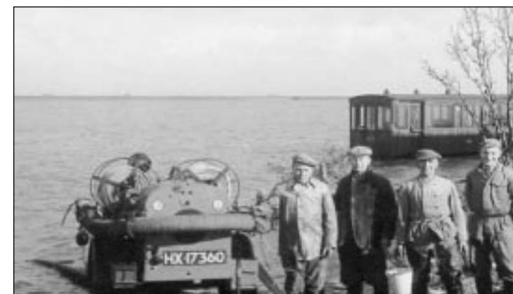
Het leegpompen van de Molenpolder in Goudswaard

Waan van de dag "We hebben het dus goed voor elkaar, maar we zijn er nog niet en we zullen er ook nooit komen", vindt de dijkgraaf, "want absolute veiligheid tegen natuurrampen kunnen we in dit land van zee en rivier, ondanks alle zorg, niet geven." Na het uitvoeren van de Deltawerken is berekend dat de overstromings-