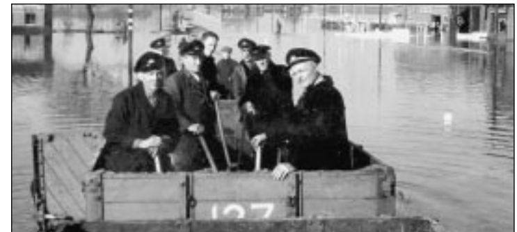
RTM-personeel op inspectietocht langs de Boonsweg