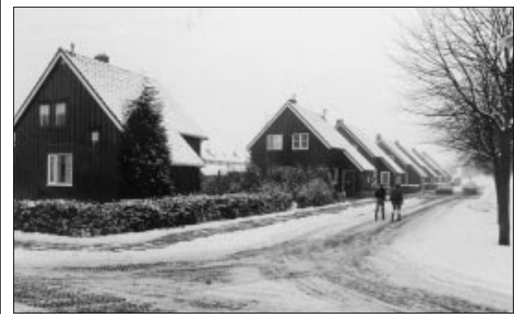
Houten woningen zijn nog her en der te vinden in de Hoeksche Waard, zoals hier op de Nieuwendijk