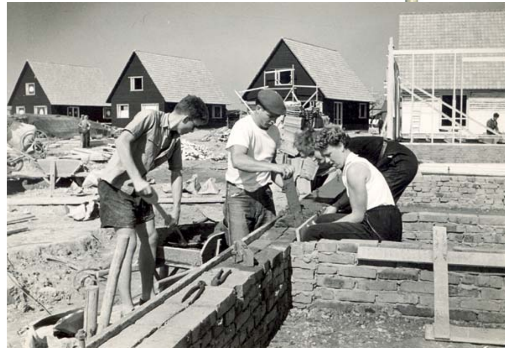
Na de watersnoodramp schonken verschillende landen huizen aan Goeree-Overflakkee. Hier worden huizen gebouwd aan het Finlandplein in Nieuwe-Tonge.