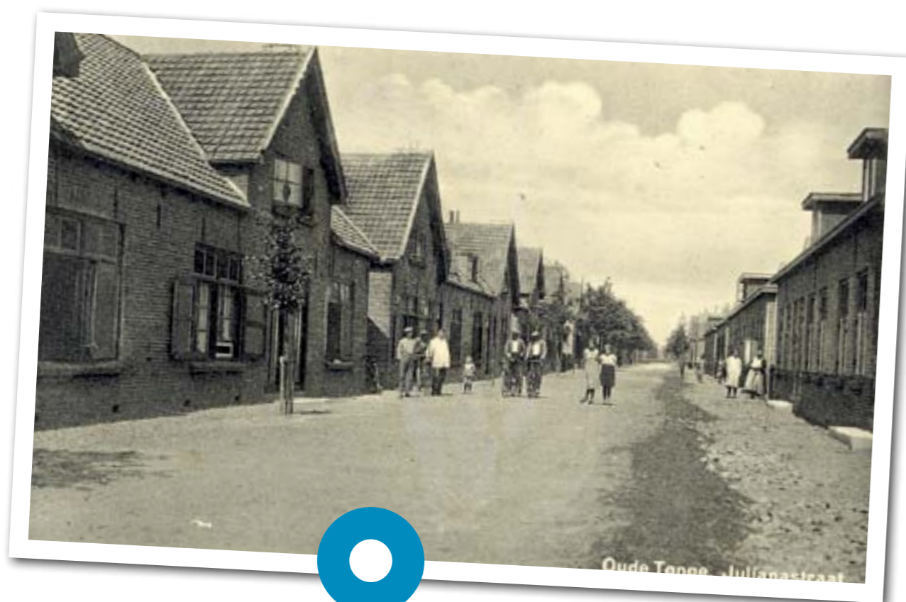
>> Voor de ramp