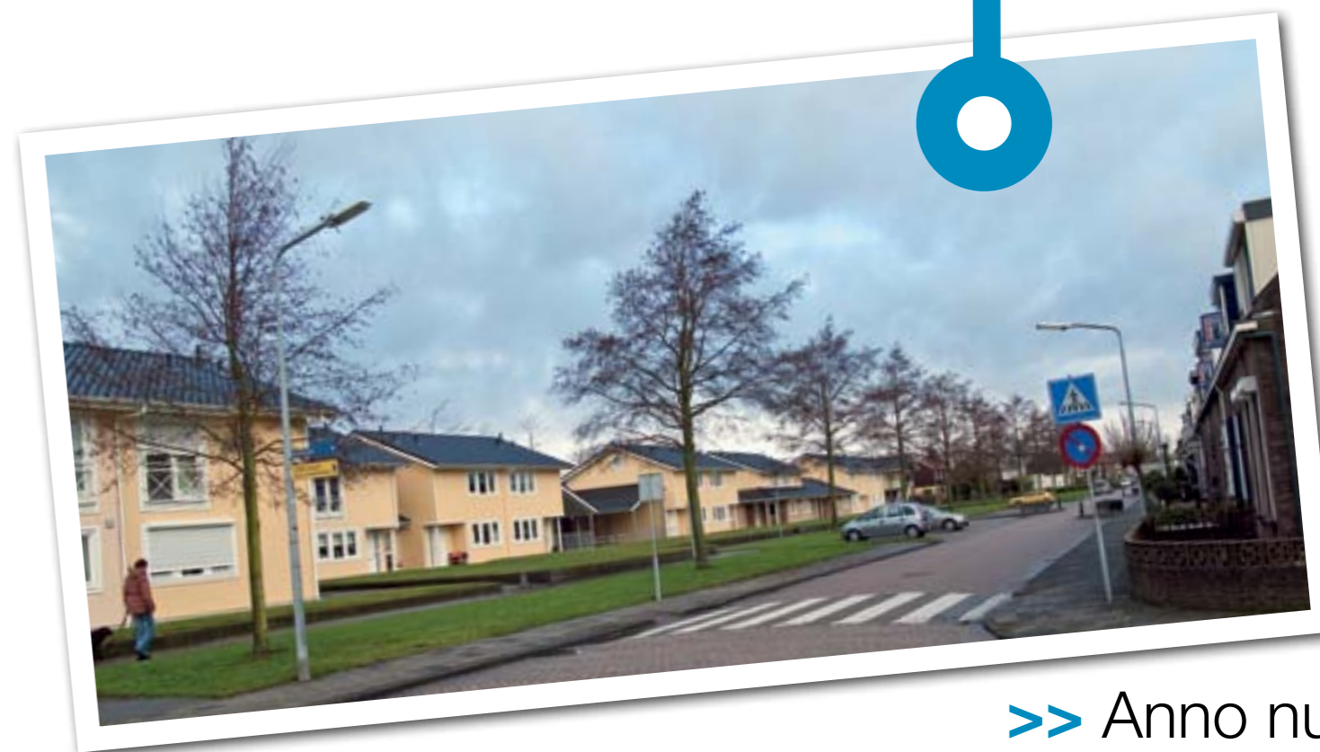
>> Anno nu