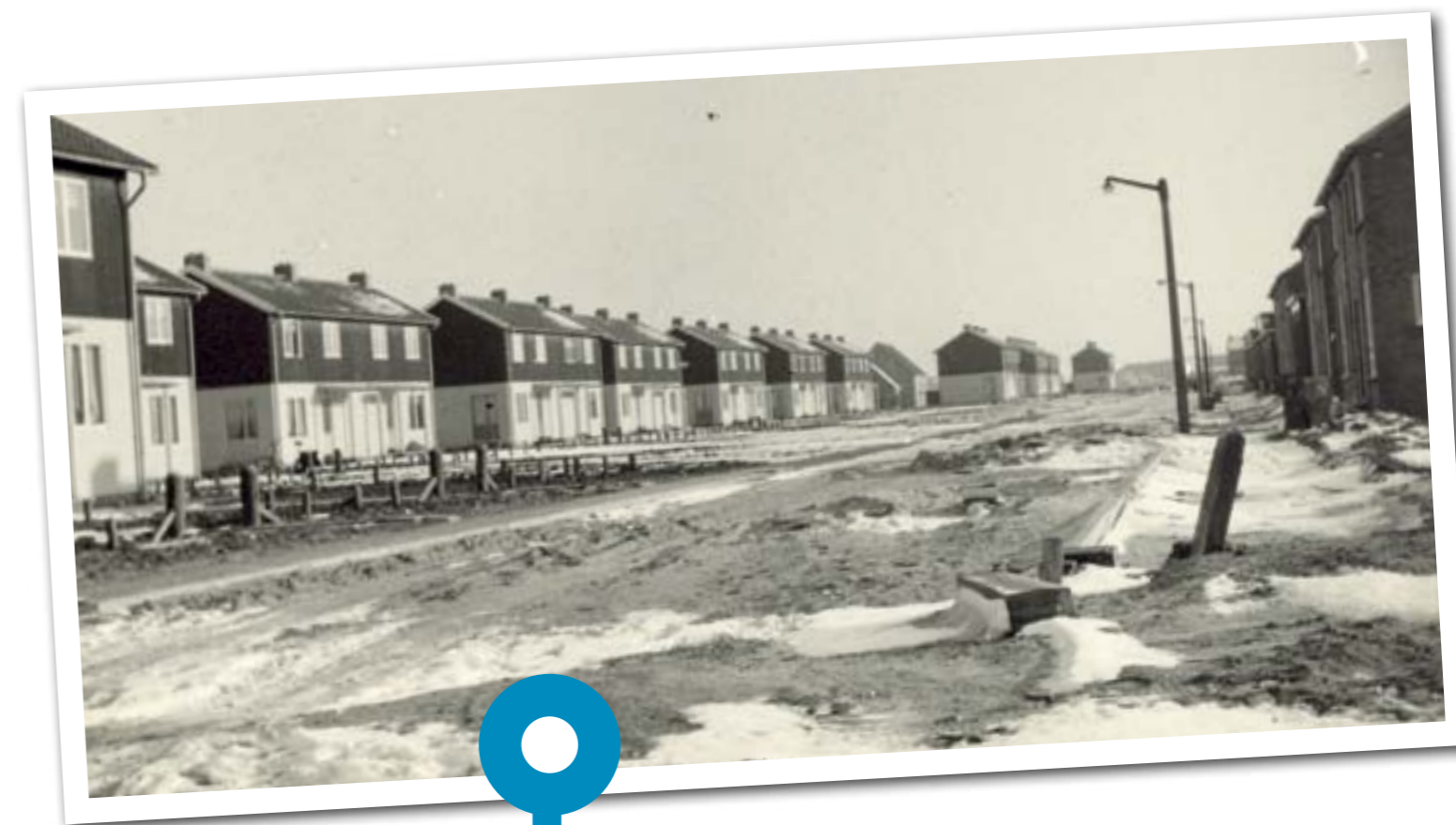
>> Tijdens de wederopbouw