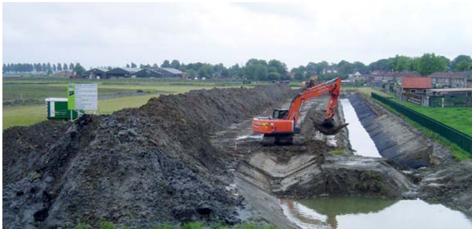
Het laatst afgeronde project is de Nieuwe Stadse Zeedijk bij Stad aan 't Haringvliet