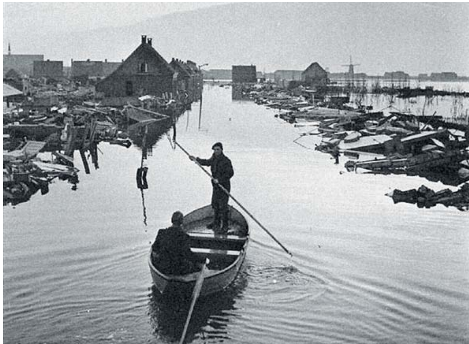
De Julianastraat in Oude-Tonge na de watersnoodramp. Meer foto's van deze straat staan op pagina 10.

Konden mensen begrijpen wat er dreigde te gebeuren of wat zelfs al gaande was? Hoe werden mensen gewaarschuwd? Konden mensen meteen vluchten, of moesten ze bijvoorbeeld eerst voor hun kleine kinderen zorgen? Kuijvenhoven verrichtte er onderzoek naar en trok conclusies. De uitkomsten legde hij vast in een boekwerk dat 18 januari jl. verscheen: 'Een straat in een dorp onder water'. Het richt zich vooral op de Julianstraat/hoek Schoolstraat te Oude-Tonge, waar veel slachtoffers vielen te betreuren. Het gehele werk geeft blijk van een zeer grondige aanpak.