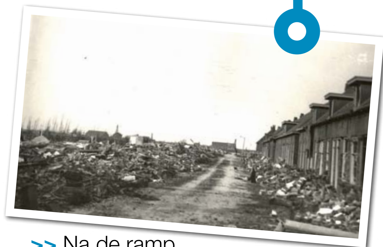
>> Na de ramp